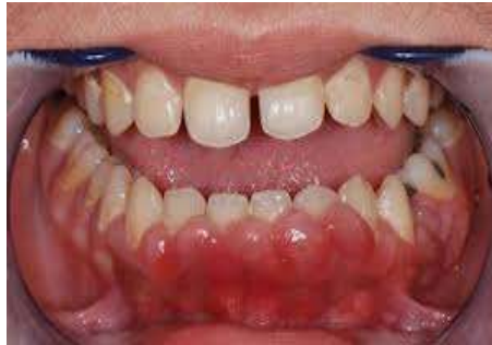
Bleeding into gums