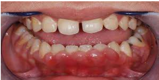
Gum bleeding & swollen