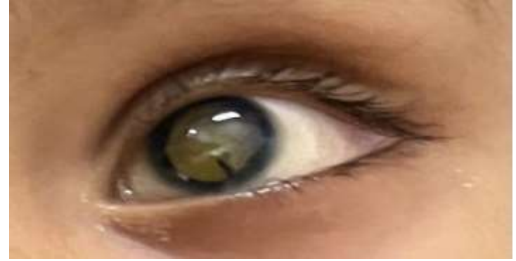
Loss of vision